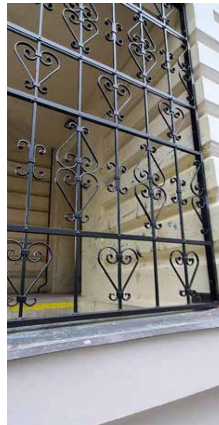
Prostor rampy zadního vstupu pošty je zabezpečen mříží