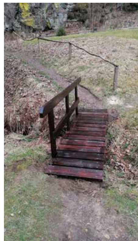
Naše TS obnovily lávky na Sýrovém potoce pod Kyjovskou přehradou