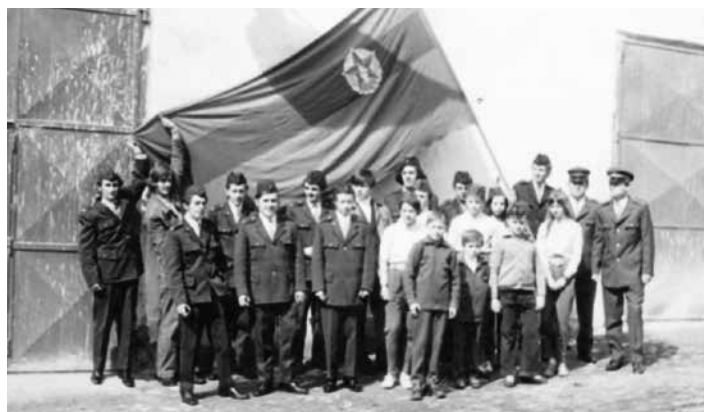
Sbor dobrovolných hasičů Krásná Lípa letos oslaví 160. výročí